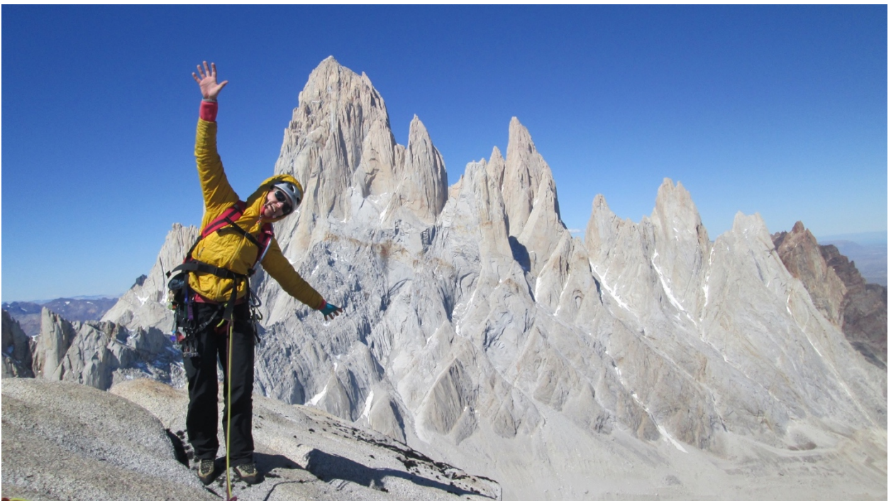
Saulė ant viršūnės su vaizdu į Chalteno (Fitz Roy) masyvą.