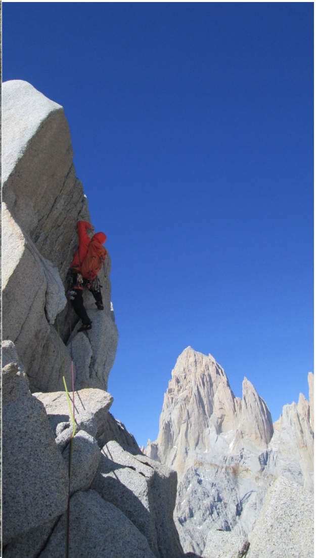
Kairėje: Gediminas maršruto vidury. Dešinėje: paskutiniai metrai iki viršūnės.