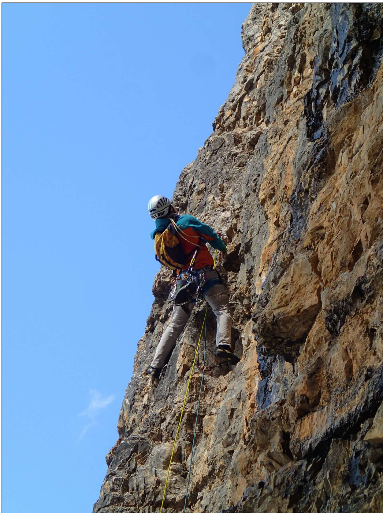
7. Juras lipa šešioliktoji virvė IV-