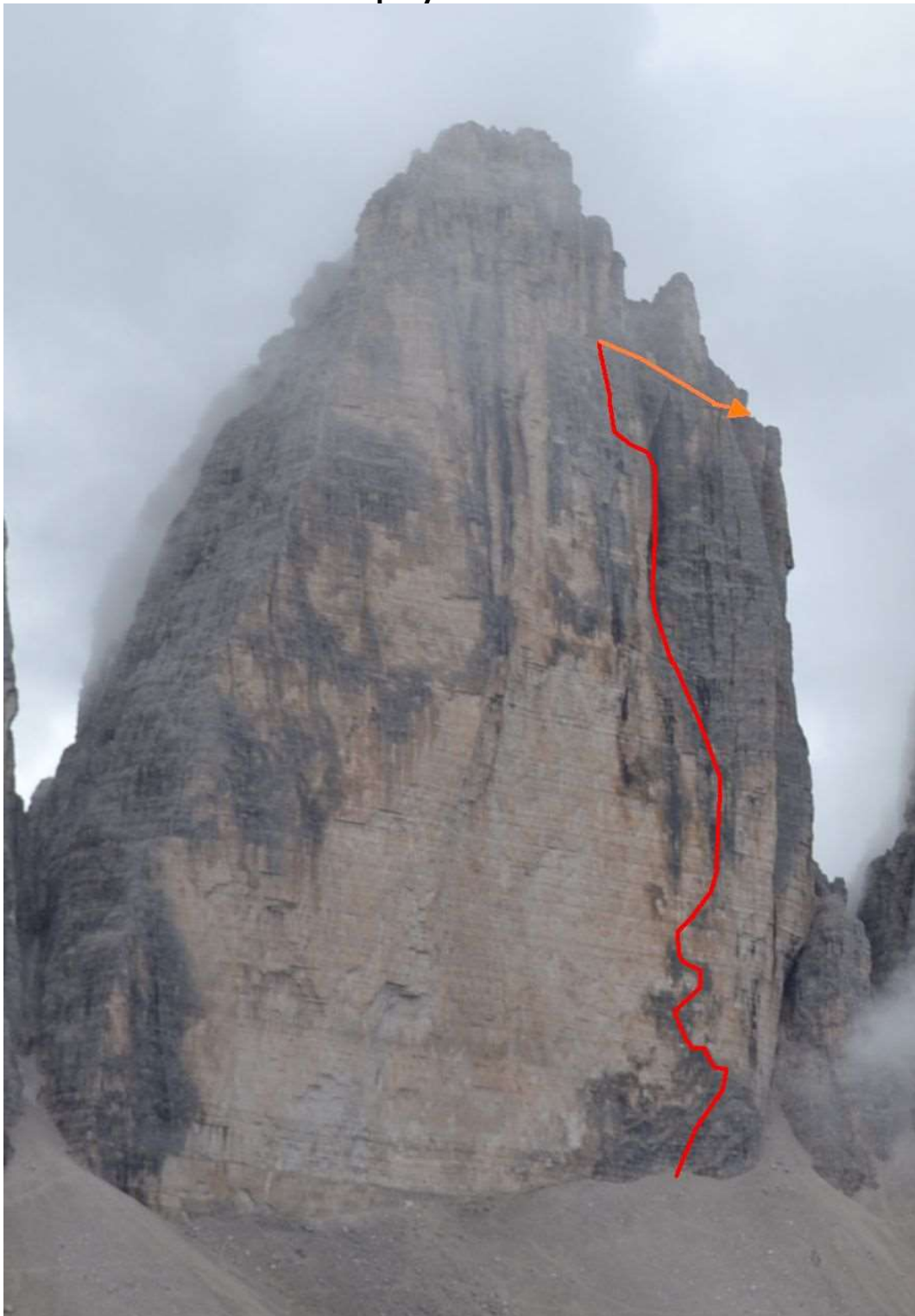
Cima Grande di Lavaredo Šiaurinė siena, su pažymėtu maršrutu

Viršūnės arba sienos nuotrauka su pažymėtu maršrutu