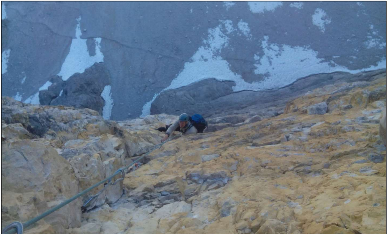
4. Robertas lipa penktąją virvę VI+