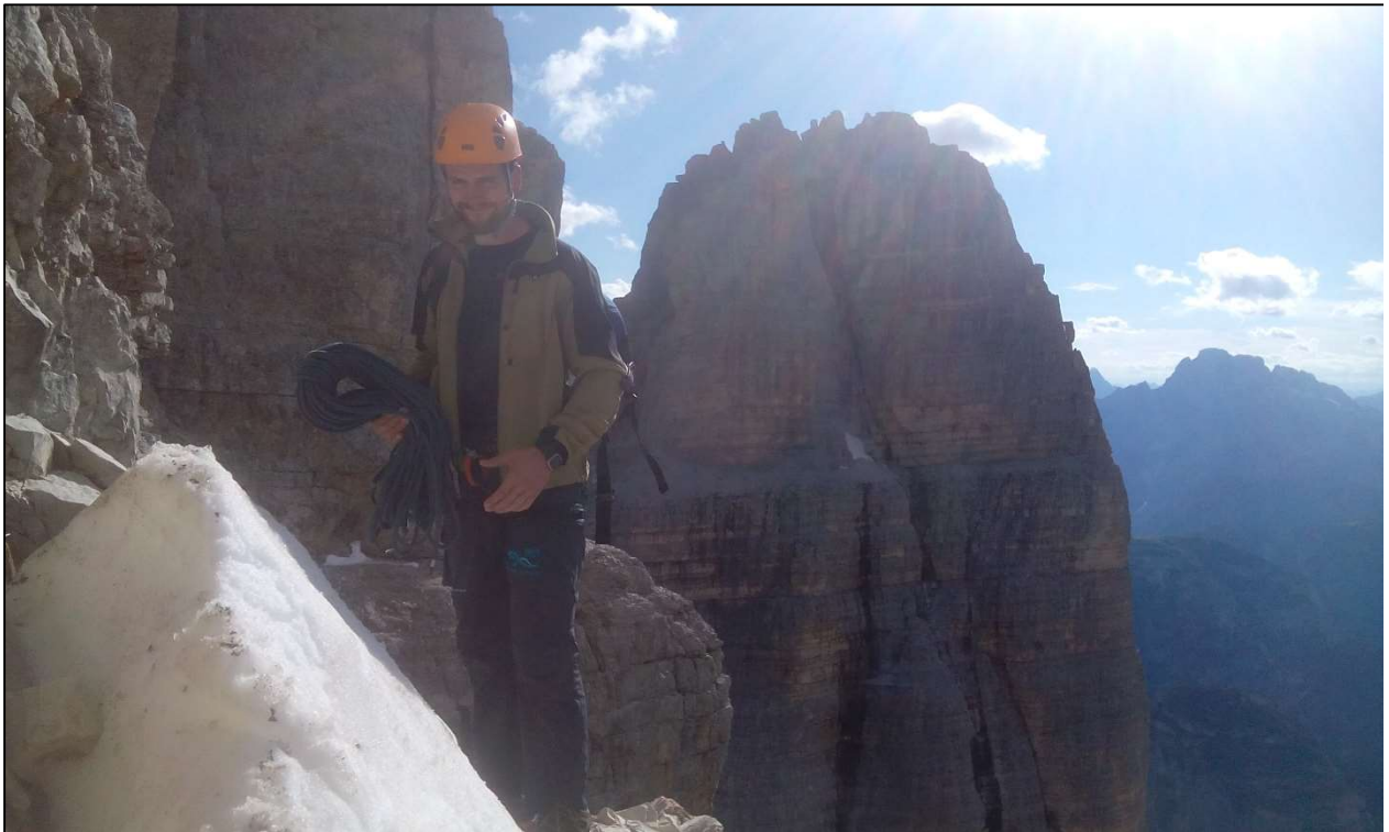
8. Maršruto viršuje ant žiedinės terasos