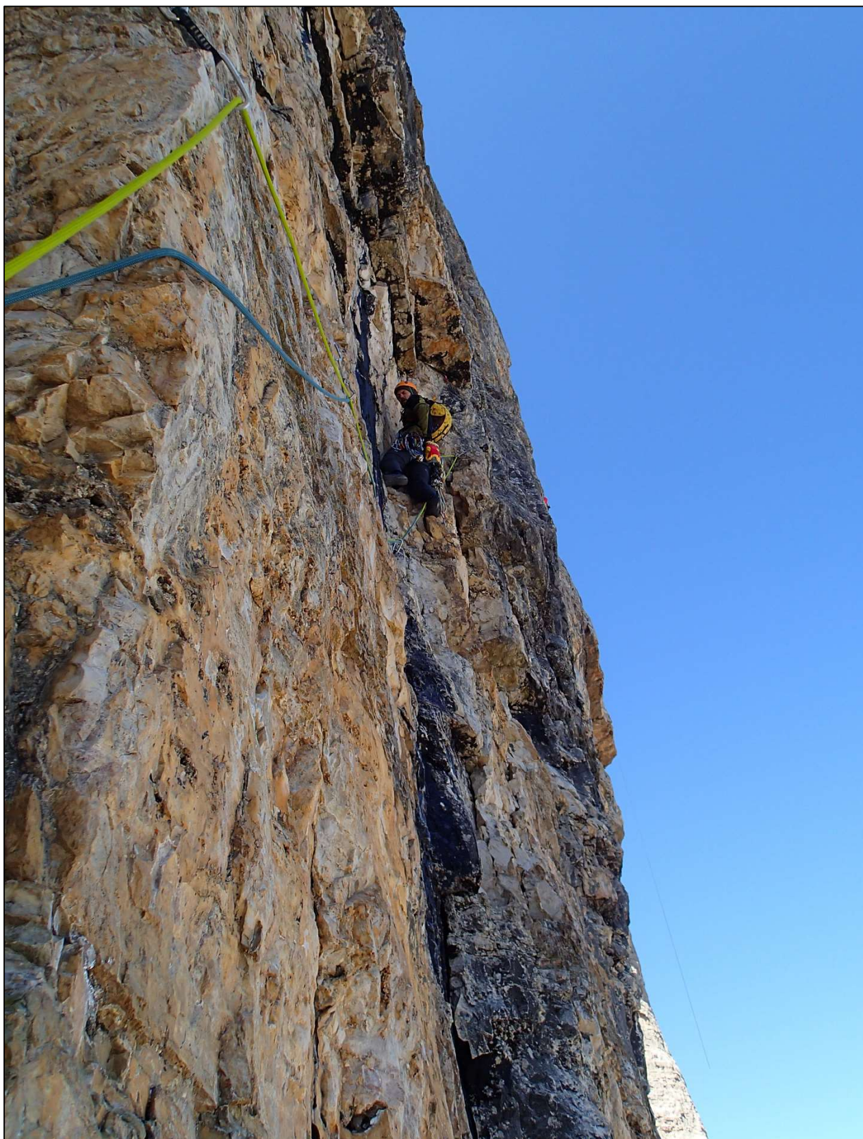
5. Mindaugas lipa septintąją virvę VI-