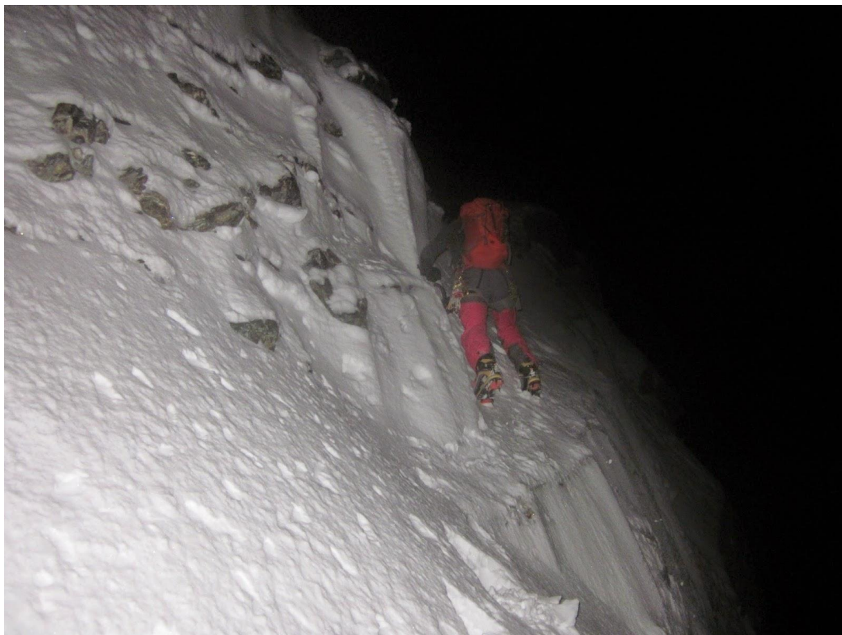
Techninio lipimo pradžia.