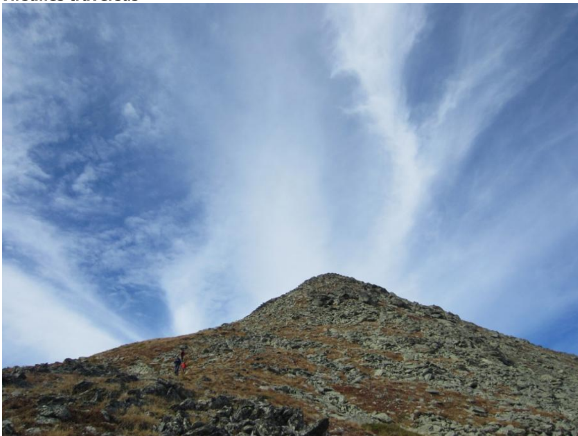
Kita viršūnēs pusē