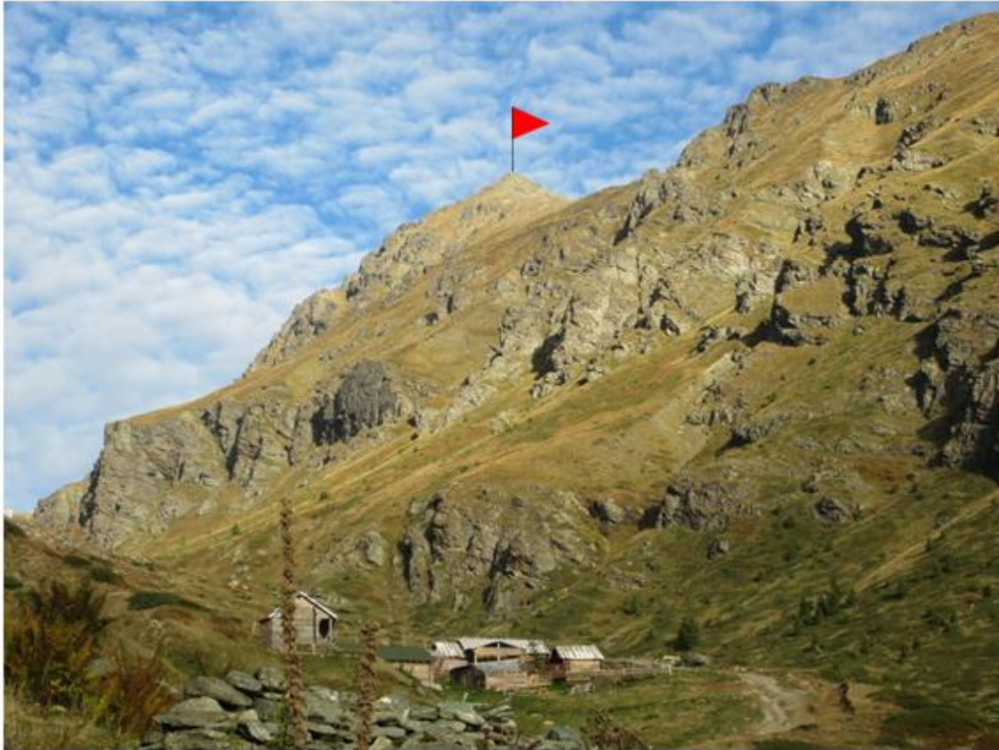
Ereniko gyvenvietė 1750 m. ( foto 3 - 4 )

Viršūnės nuotrauka su pažymėtu maršrutu.