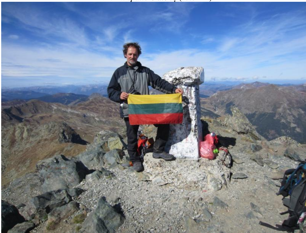
Deravica (Gjeravica) 2656 m 2015 metai