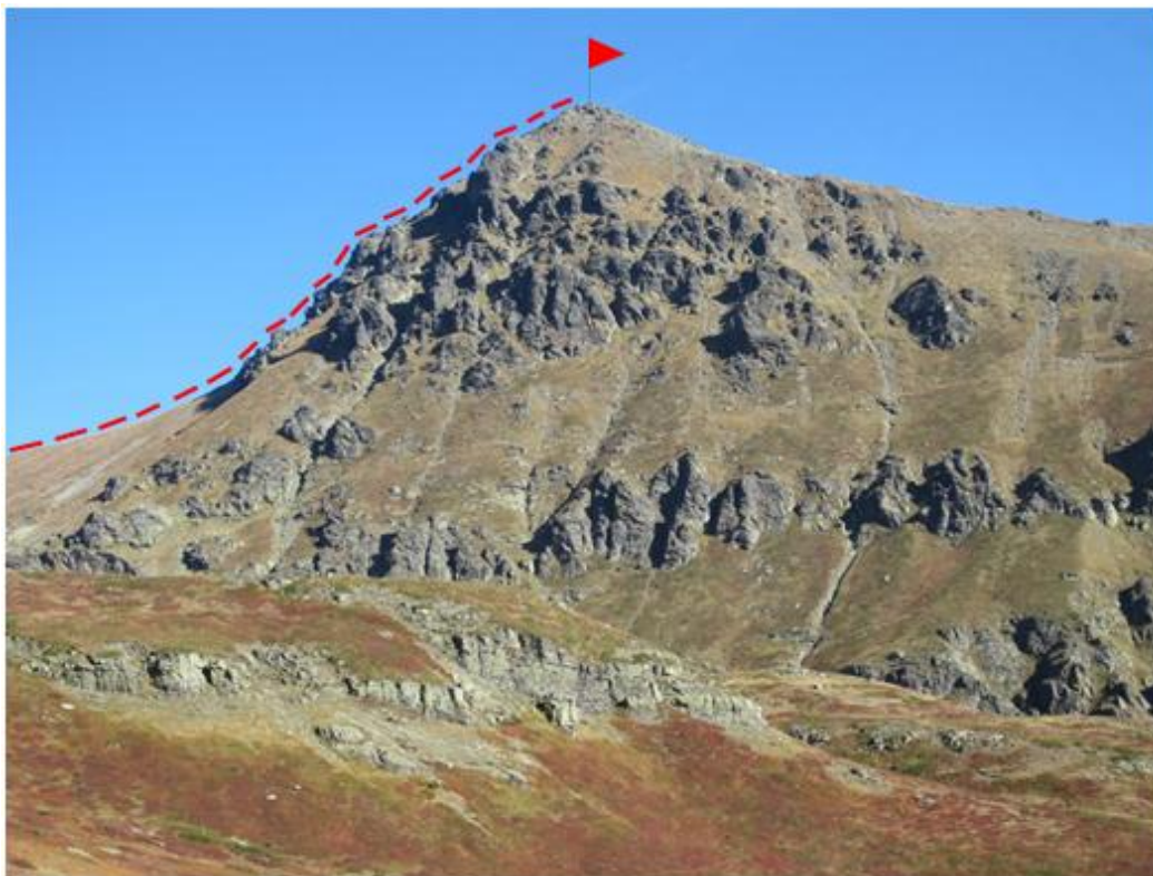
Pirmą kartą Lietuvos trispalvė aukščiausioje Kosovo viršūnėje - Deravica (Gjeravica) 2656 m. 2015 m. spalio 6 dieną (foto 1-2)