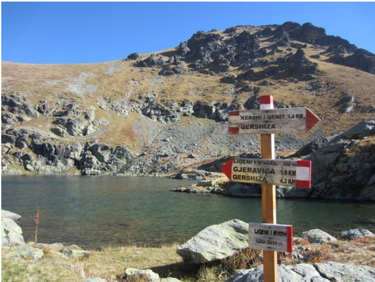
Liqeni i Madh ežeras 2312 m. aukštyje yra labai graži vieta poilsiu prie paskutinį kopimo etapą. Ežeras yra labai gilus ir šaltas.