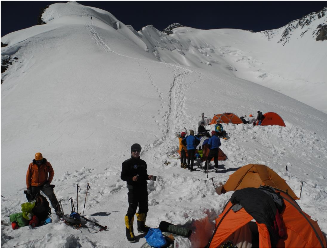
6 pav. Kelias iš 6300 link viršūnės