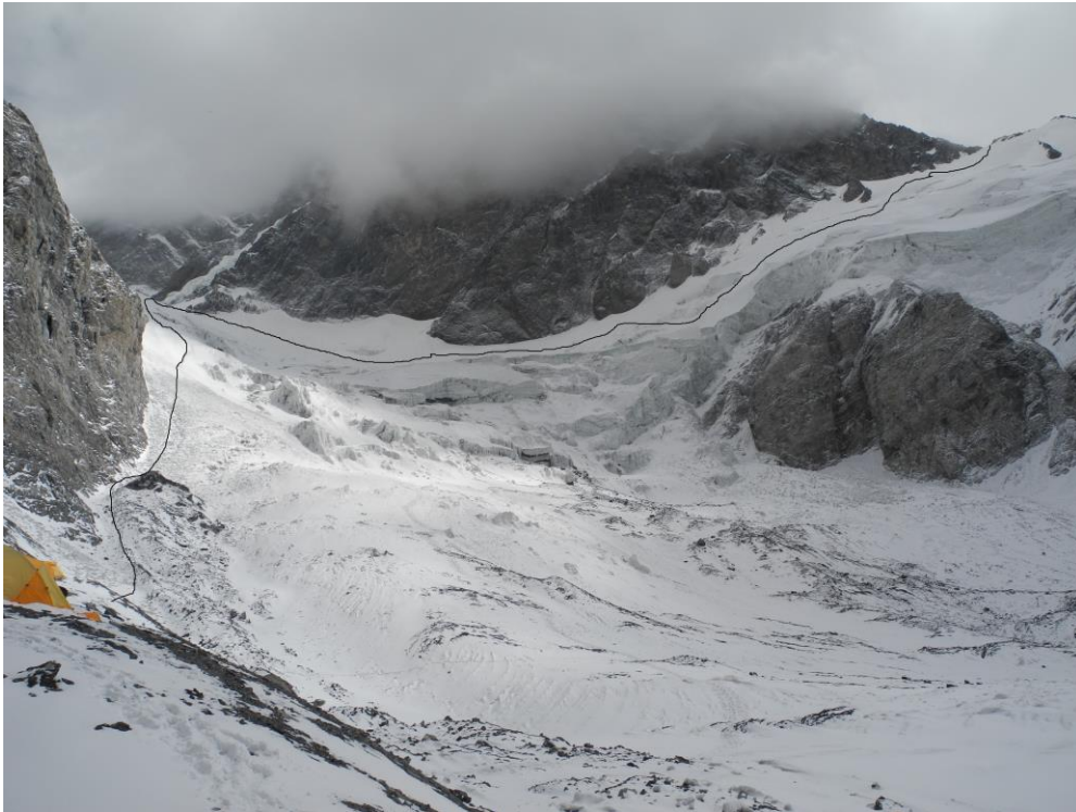
4 pav. E.Korženeva šturmas. Kelias iš 5300 stovyklos link 6100 stovyklos