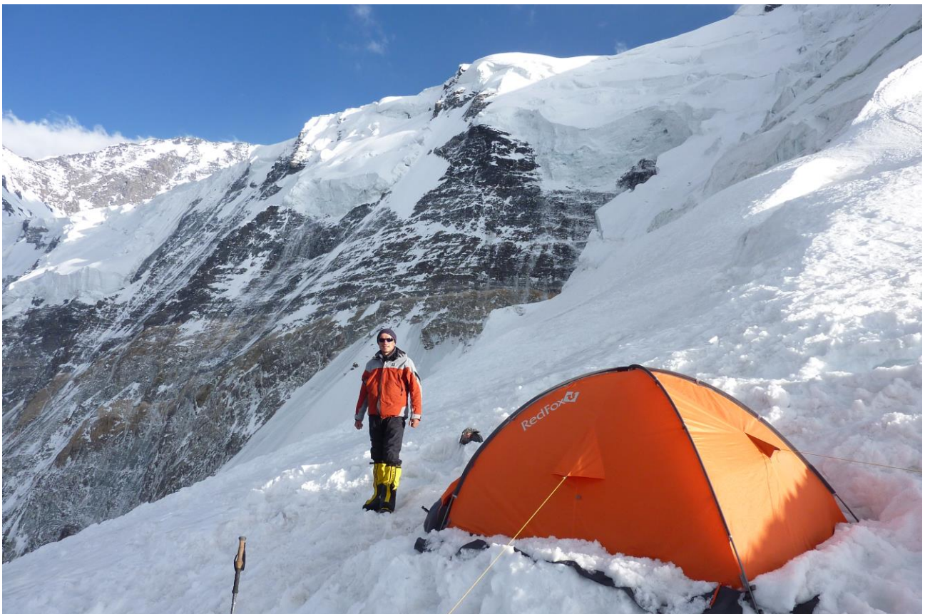
9 pav. C2 (5200 stovykla)