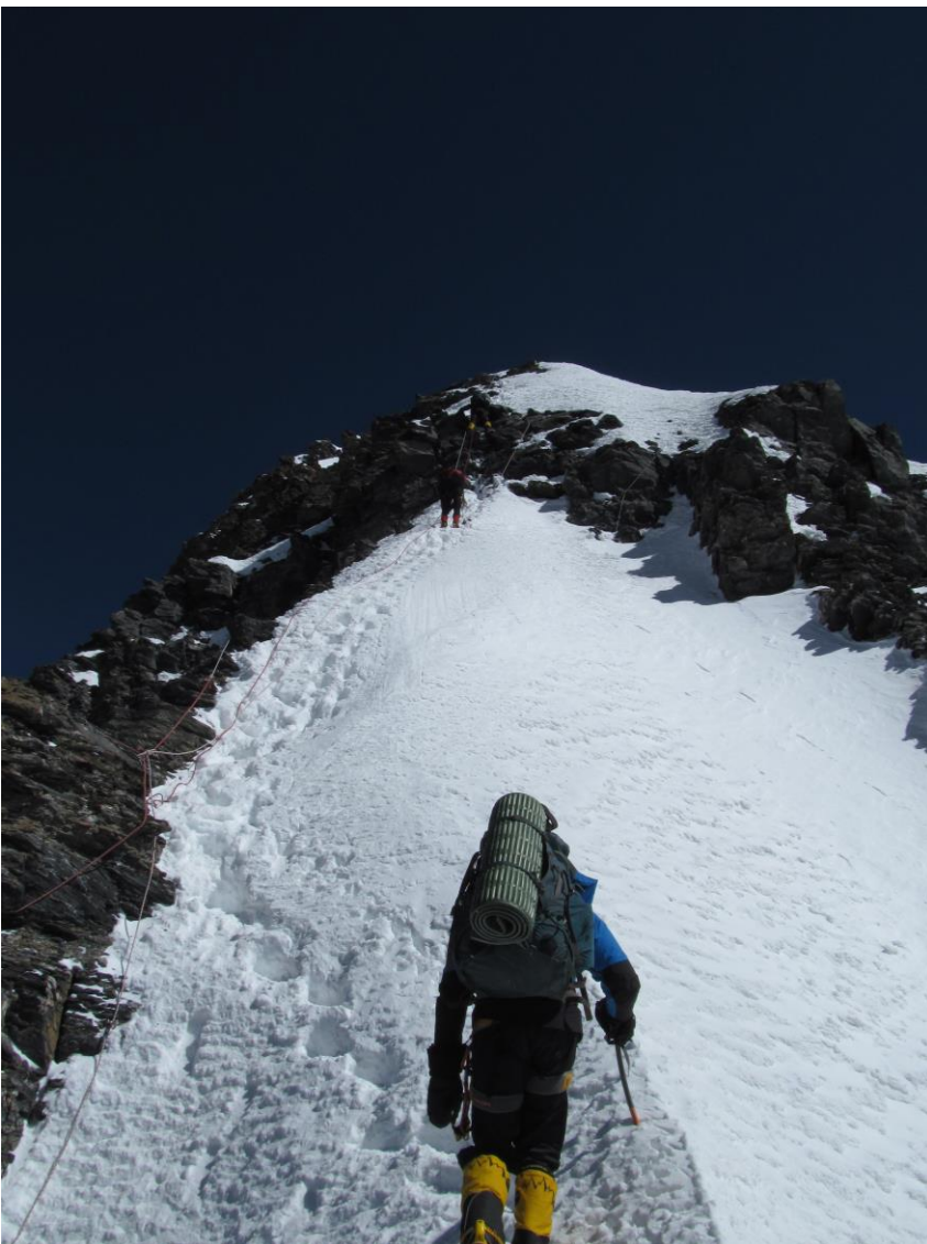
5 pav. E.Korženeva šturmas. Kelias iš 6100 stovyklos link 6300 stovyklos. Pralipimas tik su virvėmis.