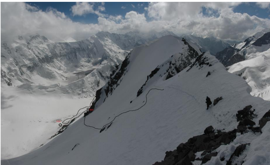
2 pav. Kelias link Četyreh viršūnės