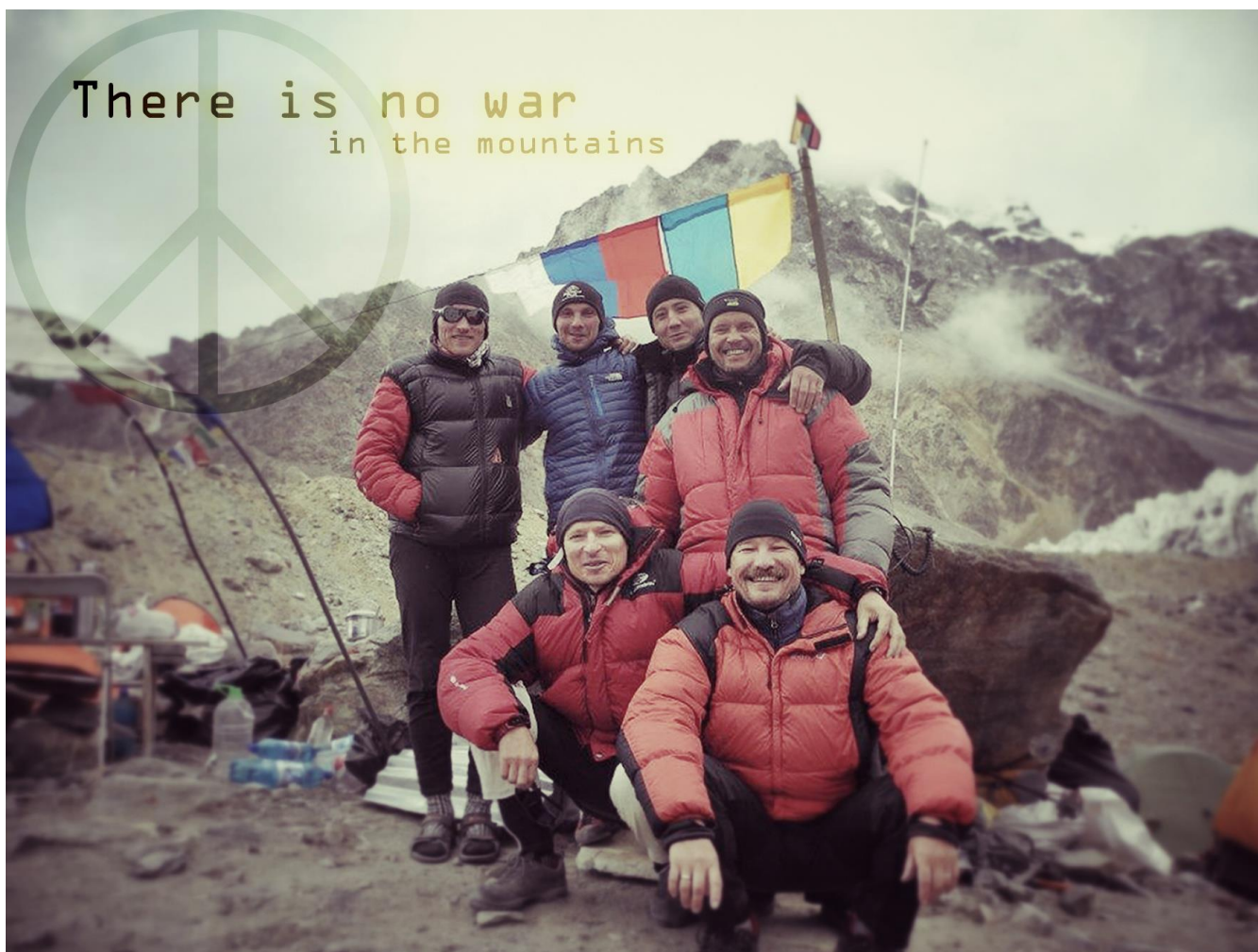
12 pav. Bendra nuotrauka komandos, kurią sudarė atstovai iš Ukrainos, Lietuvos bei Rusijos.