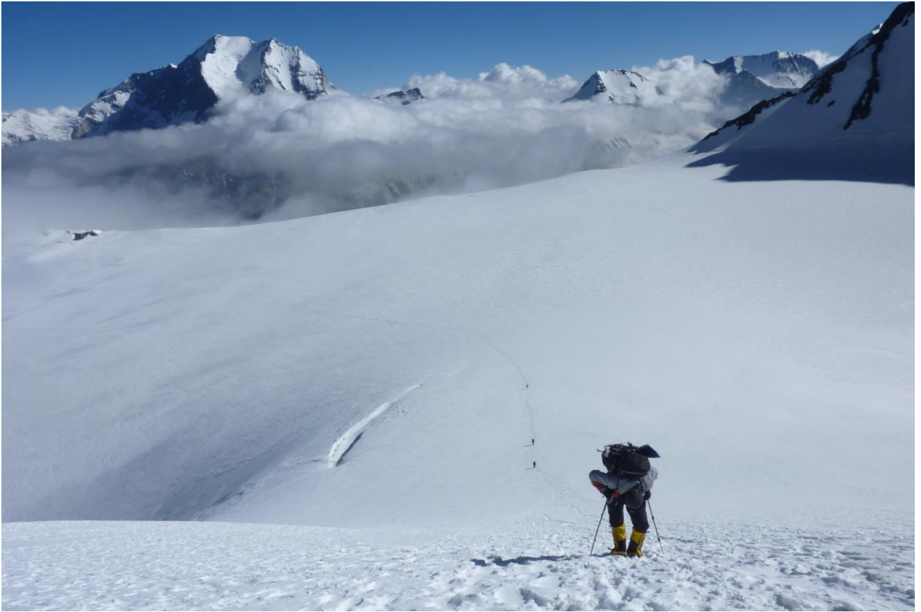
10 pav. Kylama link 6900 m. stovyklos. Matosi artėjančio blogo oro požymiai.