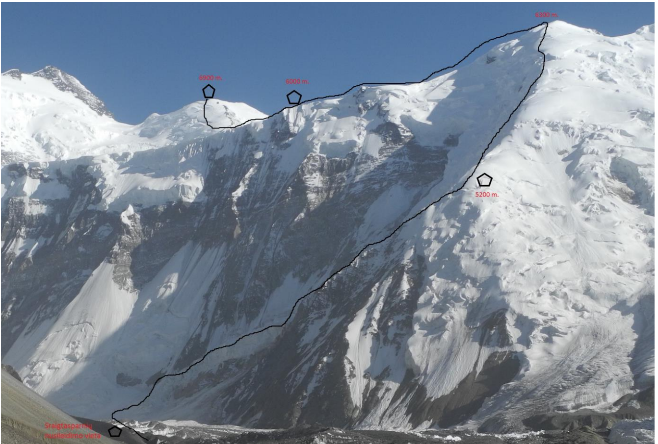
8 pav. Kelias link Ismoil Somoni