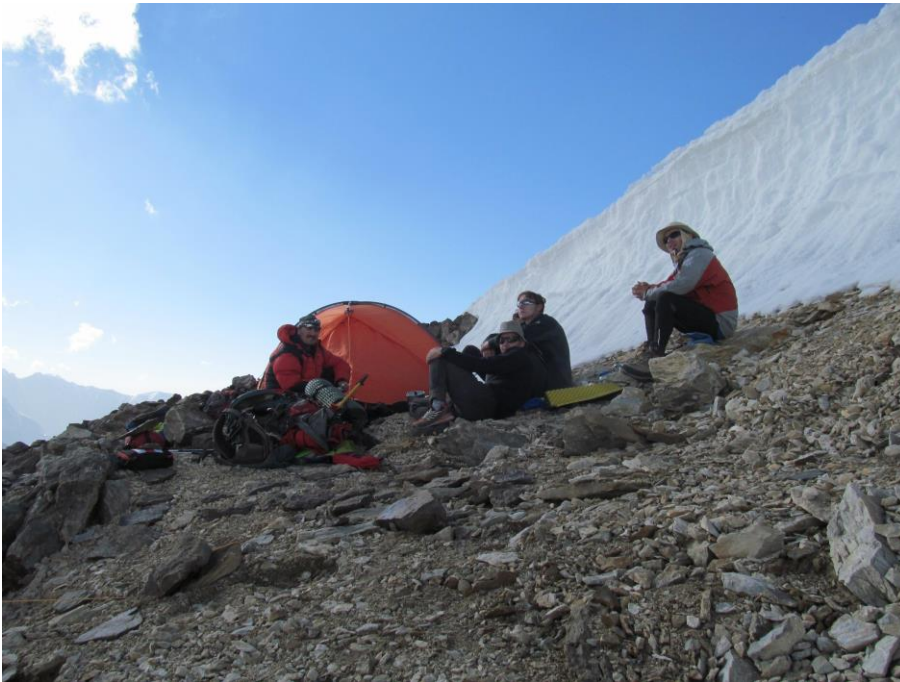
1 pav. Aklimatizacija link Vorobjovo viršukalnės. Nakvynė 5500 m.