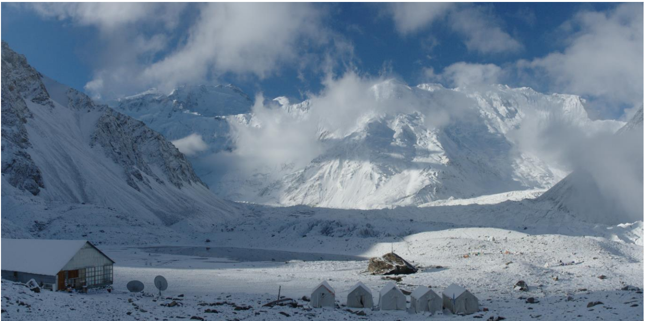
11 pav. Bazinė stovykla po kelių dienų