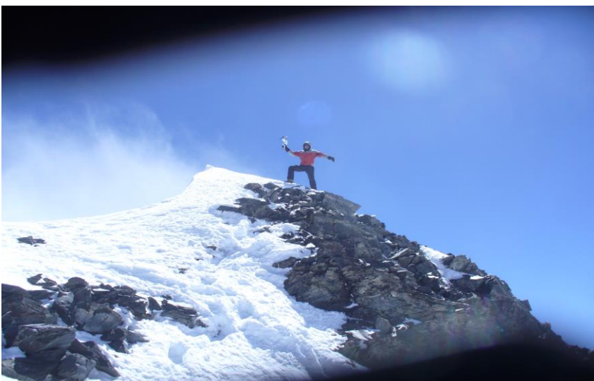
3 pav. Četyreh viršūnė