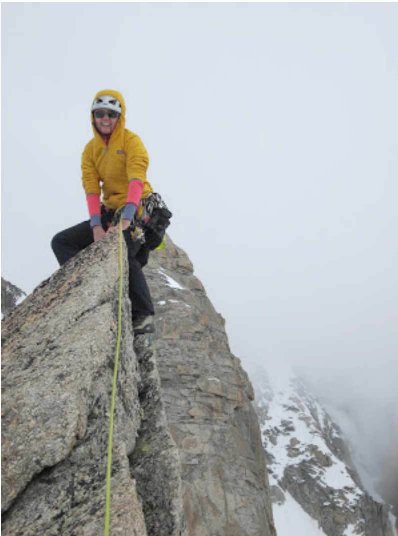
Saulė ant viršūnės