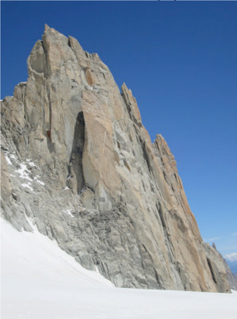
Pic Adolphe Rey

Viršūnės arba sienos nuotrauka su pažymėtu maršrutu